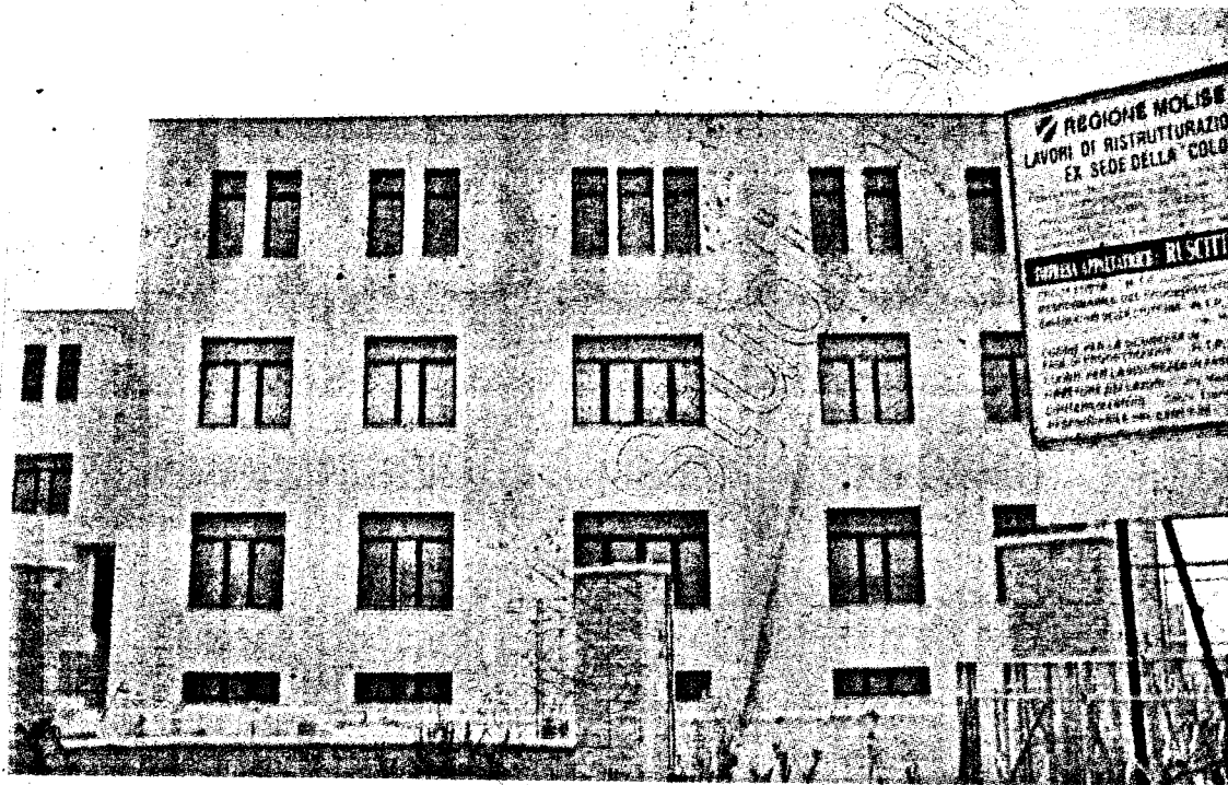
L'edificio dell'ex Colonia Marina in ristrutturazione ospiterà la sede dell'Università

La conferma è arrivata dal Rettore Cannata nel corso di una conferenza stampa