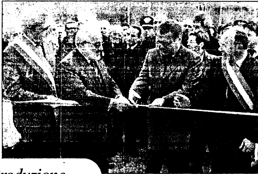
A sinistra il taglio del nastro della nuova sede di Scienze matematiche, fisiche e nucleari. A destra un laboratorio di informatica