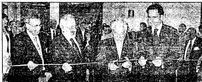
Al taglio del nastro presenti molte autorità, tra queste il vice presidente di Confindustria Pasquale Pistorio

La struttura stessa della Cittadella si pone come "mix funzionale" che possa accorpate tutte le necessità delle imprese già esistenti sul territorio o di quelle che stanno nascendo. Il polo fieristico, il polo dei servizi e il polo degli eventi sono le tre diverse parti in cui la struttura è stata suddivisa e rivalutata. "Un punto d'incontro tra idee diverse" ha dichiarato