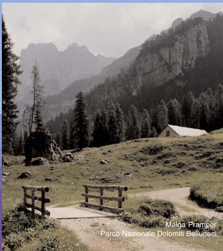
Malga Pramper Parco Nazionale Dolomiti Bellunesi