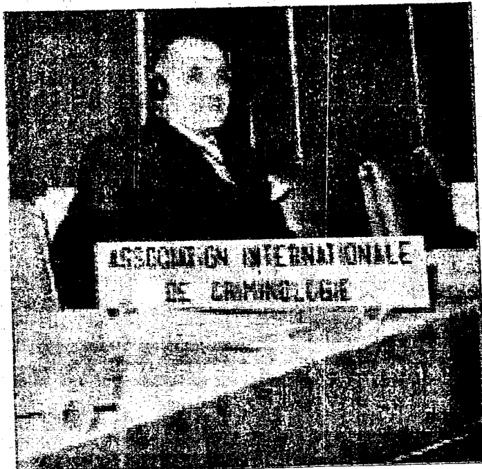
Benigno Di Tullio

Dal 1986, ogni due anni, la Società Italiana di Criminologia assegna un premio al miglior contributo scientifico in criminologia clinica pubblicato sulla "Rassegna Italiana di Criminologia" organo ufficiale della società stessa. Tale premio, istituito per onorarne la memoria, è intitolato ad un grande studioso di antropologia criminale del secolo scorso: il professor Benigno Di Tullio, nato di Forlì del Sannio. Un altro grande molisano che ha dato lustro alla nostra Regione. Medico scienziato criminologo, psichiatra di chiara fama non solo in Italia, ma nel mondo, ha dedicato tutta la sua vita di studioso cercando di applicare le sue ricerche per due grandi prospettive: la prevenzione della criminalità e la rieducazione al fine di un reinserimento nella società. L'Università degli