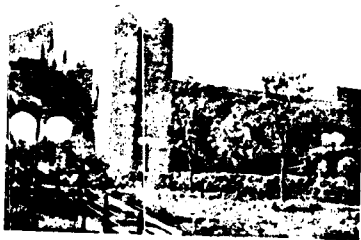
Importante Consiglio d'Amministrazione dell'Ateneo