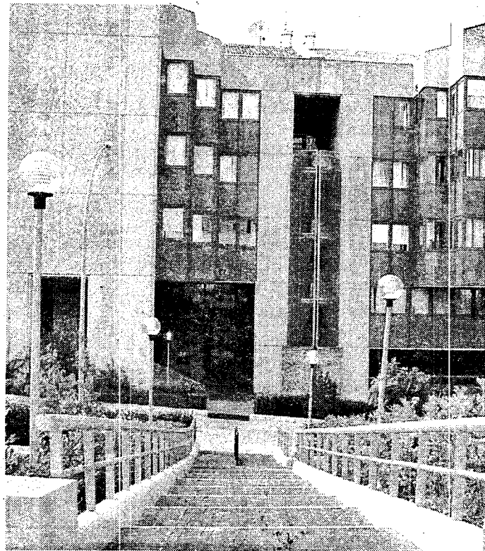
Università degli Studi del Molise

a tutti i laureandi e laureati dell'Università del Molise iscritti a una delle facoltà presenti presso l'Ateneo molisano.