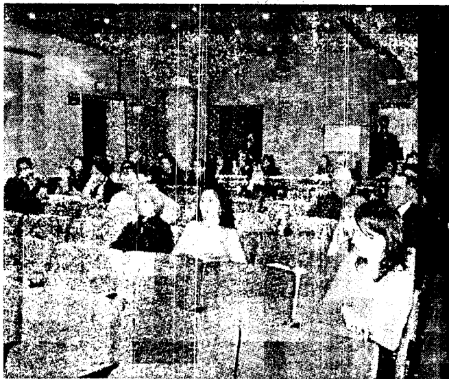
Camera di Commercio L'ente di Piazza della Vittoria ospiterà in giornata seminario e convegno