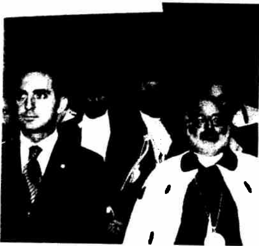
UNICEF - Vincenzo Spadafora e Giovanni Cannata

CAMPOBASSO - «La miopia è il male di oggi: occorre superare l'impasse per ottenere una vita di pace e fratellanza. Rispettando le regole, aiutando il prossimo e creando, soprattutto, una nuova cultura dell'infanzia».