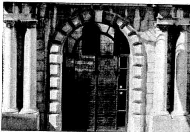
La sede di via Mazzini

E' una realtà in continua crescita l'Università del Molise e il numero delle iscrizioni per l'anno 2008-2009, è una delle più significative dimostrazioni. La giornata della matricola, tenutasi ieri mattina nella sede di via Mazzini ad Isernia, ha visto la partecipazione di oltre 300 neo iscritti, che hanno avuto un primo contatto con il nuovo percorso di studi che hanno scelto di intraprendere tra i corsi di biologia, informatica, beni culturali, lettere, scienze politiche e scienze dell'amministrazione. Ma quest'anno non si è trattato semplicemente del consueto incontro di