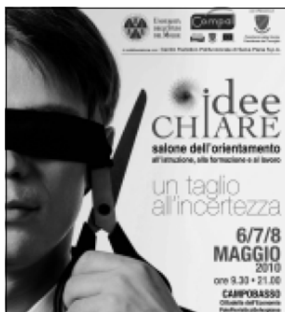
La locandina degli eventi

CAMPOBASSO. Inaugurazione stamattina alle 10.30 al Polo Fieristico della Cittadella dell'Economia di Campobasso di "Idee Chiare", il salone dell'Orientamento, dell'Istruzione, della Formazione e del Lavoro. Fino a sabato questa 'vetrina delle opportunità' per studenti, laureati, famiglie e lavoratori sarà una saggia guida per muoversi nel mercato del lavoro in Molise nel "delicato" presente e nel prossimo futuro. Promotori della manifestazione e co-organizzatori con il Centro Fieristico Polifunzionale di Selvaapiana S.p.a. sono la Co.m.pa.l. la Regione Molise, l'Università degli Studi del Molise, le Province di Campobasso e Isernia, l'intero Sistema Camerale della regione, il Comune di Campobasso, l'Ufficio Scolastico Regionale, il Patto per il Matese e l'Agenzia Regionale Molise Lavoro. Previsto un ricco calendario di eventi, convegni e workshop per indicare agli studenti come valorizzare le proprie competenze e agli aspiranti lavoratori quali sono le migliori opportunità offerte dalle imprese e dalle organizzazioni pubbliche regionali. Sarà presente come espositore anche la Scuola Allievi Agenti della Polizia di Stato di Campobasso, la quale proporrà