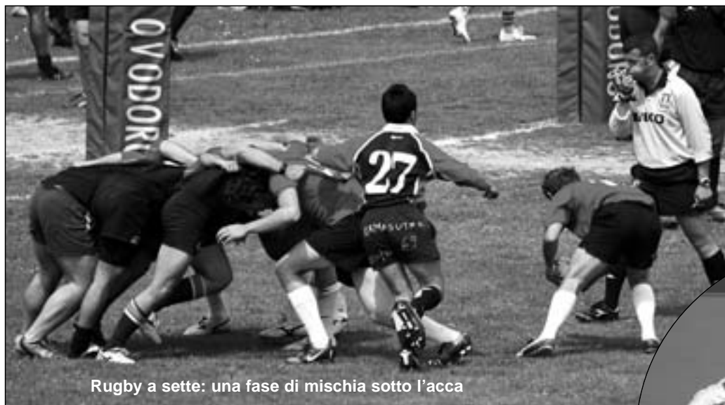
Rugby a sette: una fase di mischia sotto l'acca