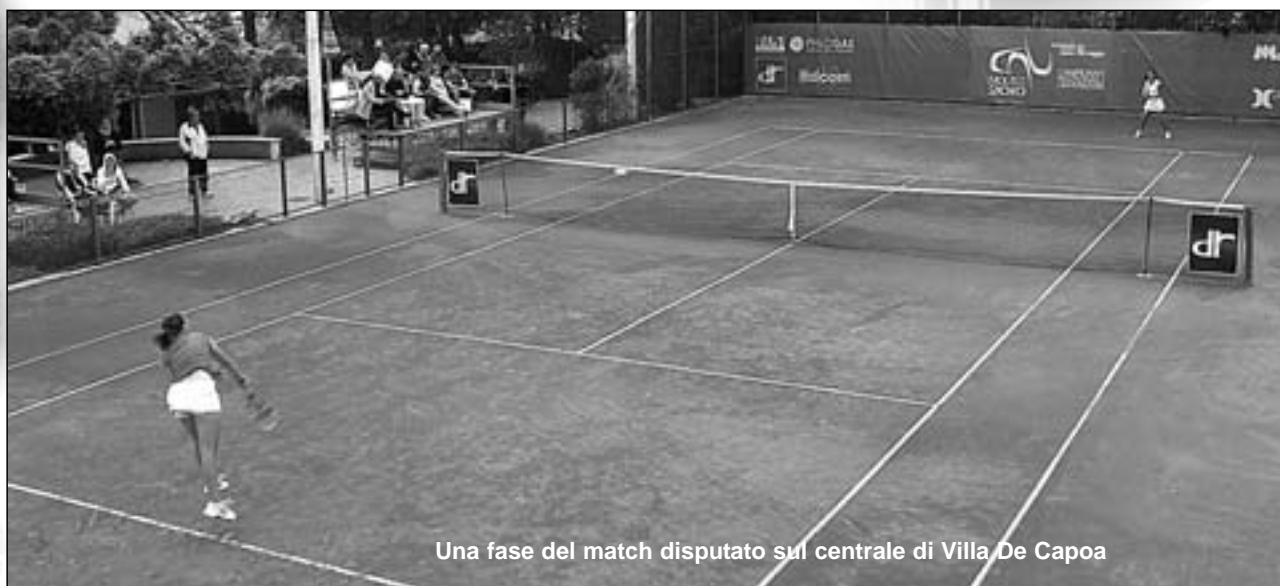
Una fase del match disputato sul centrale di Villa De Capoa

I campi in terra rossa di Villa De Capoa, insomma, potrebbero essere uno scrigno di speranze non indifferente per una figlia del territorio pronta a far entusiasmare tutti i propri fans (e concittadini). Del resto, riuscire ad imporsi a domicilio ha un valore duplice. Soprattutto a livello di convinzione ed energia.