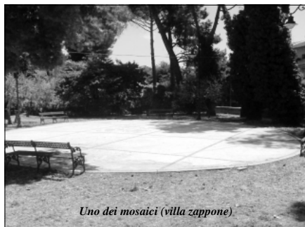
Uno dei mosaici (villa zappone)

gettualità grandiosa sfoga passione nel cuore generazionale nel nostro tempo. Sfoga nel Parco Archeologico di Villa Zappone patrimonio prezioso della città e della sua gente. Ecco la grazia scendere negli occhi e nei polmoni della città e sommessamente riportare nell'anima dei suoi abitanti il gusto del benessere. Si vedono madri al mattino presto con i loro bambini; qualcuna abbraccia il dono dalla carrozzina lo poggia sul piano del giardino e gli fa muovere i primi passi nello spazio sano e bello del parco. Il bambino sorride, muove le gambe verso il più importante obiettivo della sua vita. Apprende a camminare. La scena è magnifica. Ecco la prima generazione che difenderà con tutto il cuore e l'anima la bellezza che l'ha svezzata e che per diritto d'amore le appartiene. Si ascolta il canto della grazia. La vita bella ricomincia per tutti”.