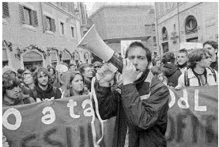
Un corteo di protesta contro la riforma del ministro Gelmini (a sinistra)