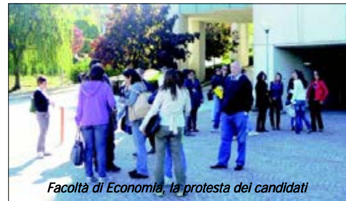
Facoltà di Economia, la protesta dei candidati

lontanato, mentre nessuno è stato bloccato". Tra le voci si è distinto qualcuno che pare avesse la capacità di rispondere alle domande, ma la maggioranza è stata schiacciante. Sulle 335 persone che erano riuscite a