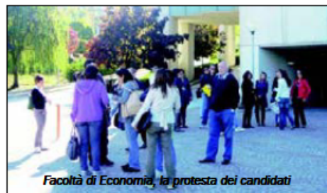
Facoltà di Economia, la protesta dei candidati

Ammissione Tfa, i candidati contestano la prova d'esame