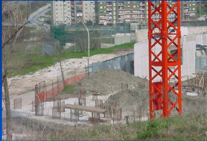
Lavori del Palazzo dello Sport Universitario