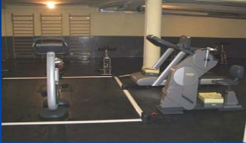
Palestra di Ateneo