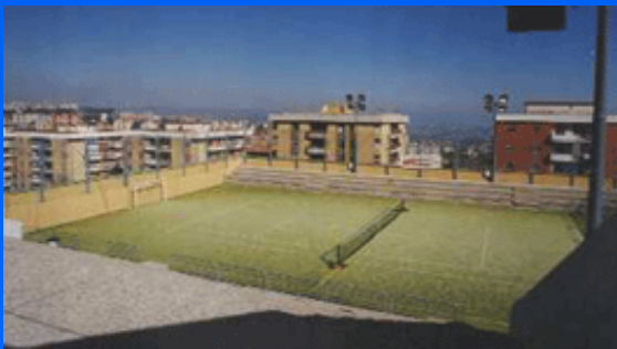
Campo in erba sintetica polifunzionale