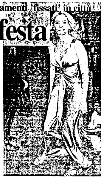
Julia Roberts ha interpretato un film sul 'ricatto' delle donne

del Comune di Campobasso ha organizzato un recital, a partire dalle 19,