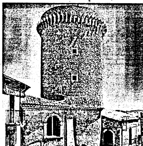
La torre angioina di Colletorto

decisamente importanti al fine di una corretta alimentazione. L'olivella molisana, personaggio animatore di un viaggio fantasioso a partire dalle tracce di una storia antica, è stata disegnata da Giancarlo Civerra. Dai templi sanniti ai tracciati tratturali che conducono fino al Basso Molise prende corpo l'importanza della Dop. Sigla che tutela il valore di quelle caratteristiche dell'olio legato alla zona di produzione per garantire la varietà delle olive, la zona di origine, le principali caratteristiche e i modi di coltivazione. Sulla copertina del fumetto il castello Pandone di Venafro e la Torre Angioina della Regina Giovanna d'Angiò di Colletorto. Simboli di due realtà. Roccaforti della pianta mediterranea collocate agli antipodi di un contesto territoriale punteggiato da oliveti secolari e da nuovi impianti argentei. Da valorizzare con percorsi culturali e gastronomici in cui prevalga l'olio extravergine di oliva. Orgoglio di queste realtà che rappresenta una grande opportunità destinata a migliorare le condizioni territoriali.