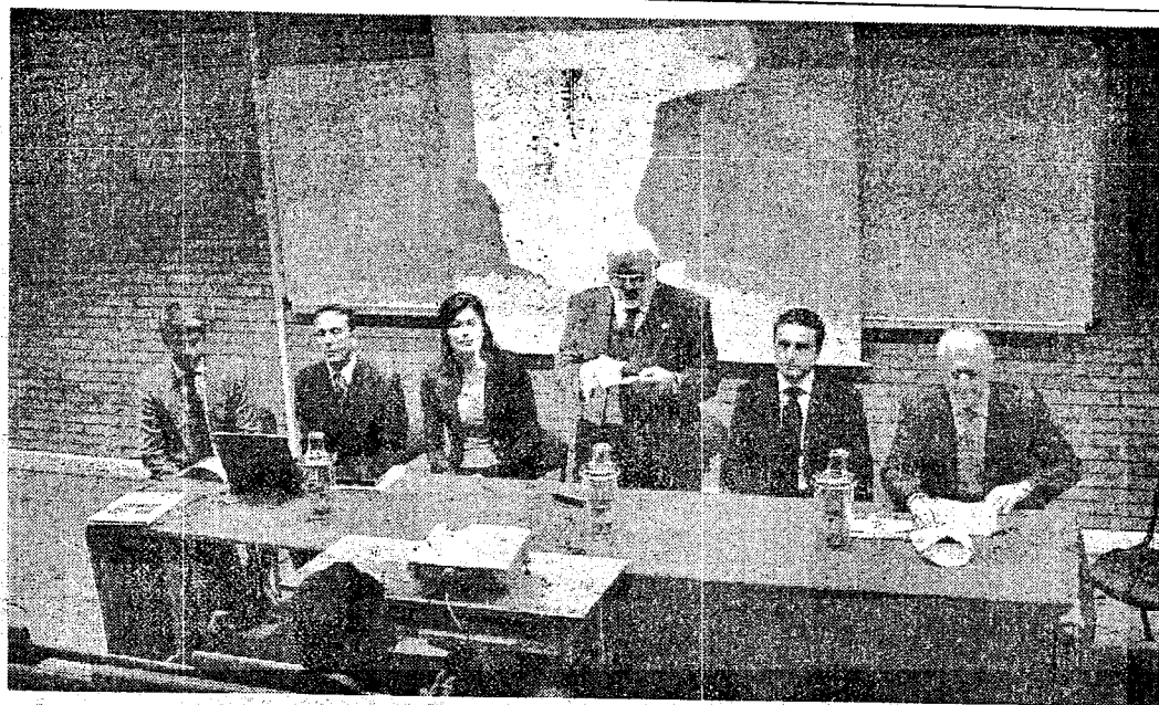
Un momento del seminario di ieri pomeriggio all'Università