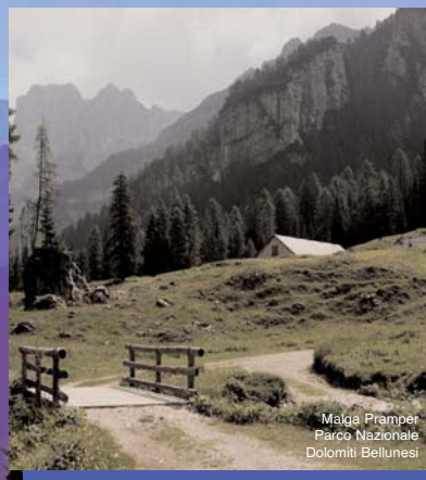
Maja Prampet Parco Nazionale Dolomiti Bellunesi