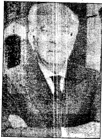
Il senatore Colombo