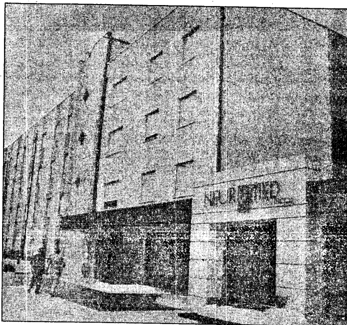
Il centro medico dell'Istituto Neuromed a Pozzilli

POZZILLI. Come già avvenuto nella convenzione con l'Università "La Sapienza" di Roma, che regola rapporti e attività nel settore delle neuroscienze, l'Istituto Neuromed si relaziona anche ad un'altra realtà di ricerca universitaria, impegnandosi a collaborare con la Facoltà di Medicina e Chirurgia dell'Università degli Studi del Molise, per la programmazione e attuazione di progetti di formazione e di ricerca, di attività di stage, di utilizzo di piattaforme tecnologiche nell'ambito delle neuroscienze, della medicina molecolare e dei settori scientifici collegati. L'occasione è data dalla recente inaugurazione in Molise del Polo Didattico della Facoltà di Medicina e Chirurgia dell'Università degli Studi del Molise. Cerimonia memorabile svoltasi lo scorso aprile alla presenza delle più elevate cariche politiche, militari e religiose molisane. L'inaugurazione del Polo Didattico ha