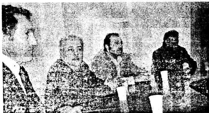
In alto a destra la maschera. Sopra un momento della conferenza