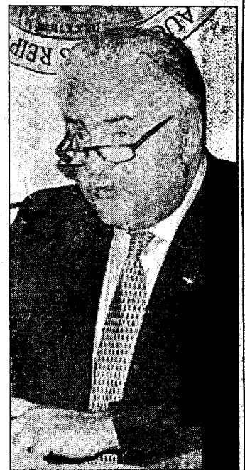
Cannata e Ceglie