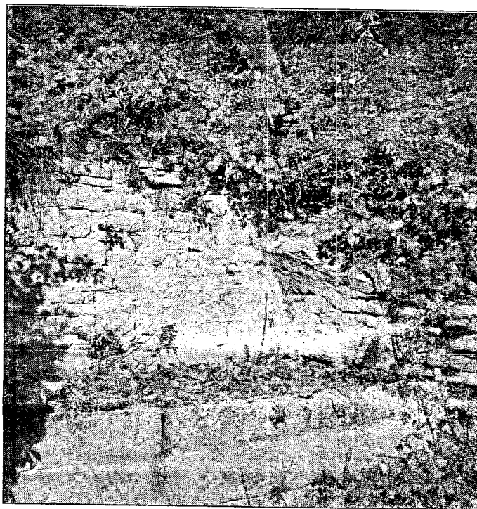
La fontana romana

clopiche di epoca sannitica. Un'area quindi di estrema rilevanza storica quella che gli scavi del professor Raddi stanno riportando alla luce. Sulle dinamiche insediative che hanno interessato il sito alle porte di Agnone si avranno informazioni maggiormente dettagliate dalla conferenza stampa di domani.