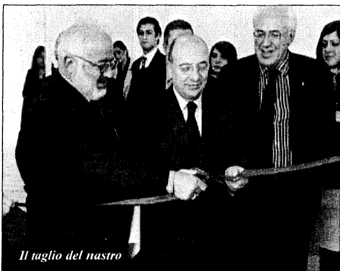
Il taglio del nastro

CAMPOBASSO. Orientare i giovani all'istruzione, alla formazione e al lavoro. E' questo l'obiettivo di "Idee Chiare": tre giornate di riflessione e confronto sul tema dell'occupazione, inaugurate ieri mattina presso la Cittadella dell'Economia del Polo Fieristico di Selvaiana.