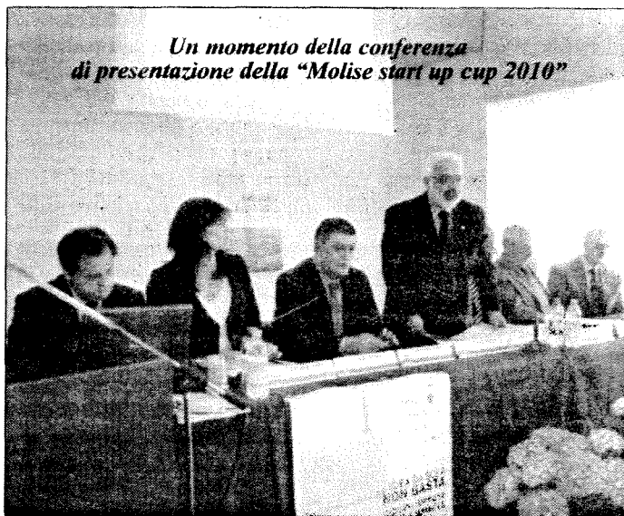
Un momento della conferenza di presentazione della "Molise start up cup 2010"