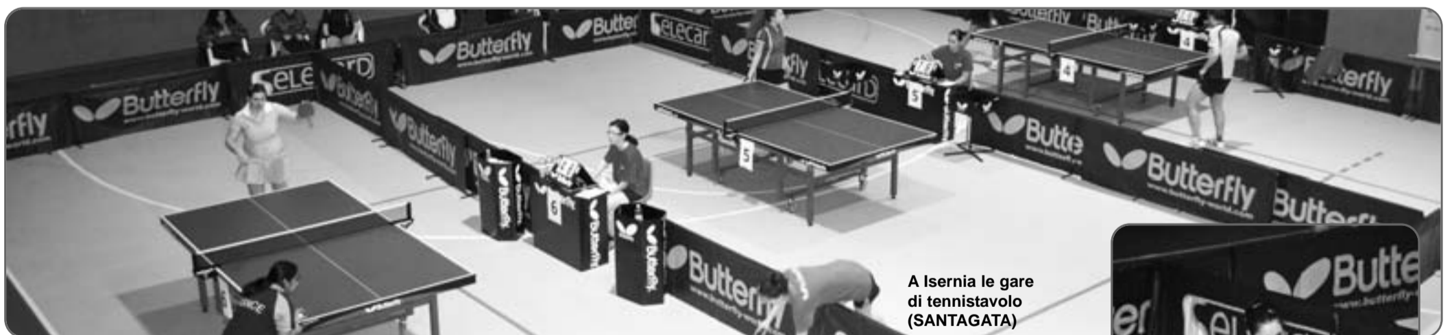
A Isernia le gare di tennistavolo (SANTAGATA)

-100 kg, il portacolori del Cus Milano, ha affrontato tre combattimenti (contro due alfieri del Cus Torino, al primo turno ed in finale, e nel mezzo un portacolori del Cus Genova) vincendoli tutti e tre per ippon e ricevendo i complimenti dei tanti amici presenti e del mae-