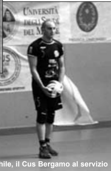
Volley maschile, il Cus Bergamo al servizio

Sul fronte tennistico, tre le gare disputate e due saltate per forfait (assenze, peraltro, giustificate).