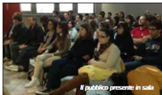
Il pubblico presente in sala