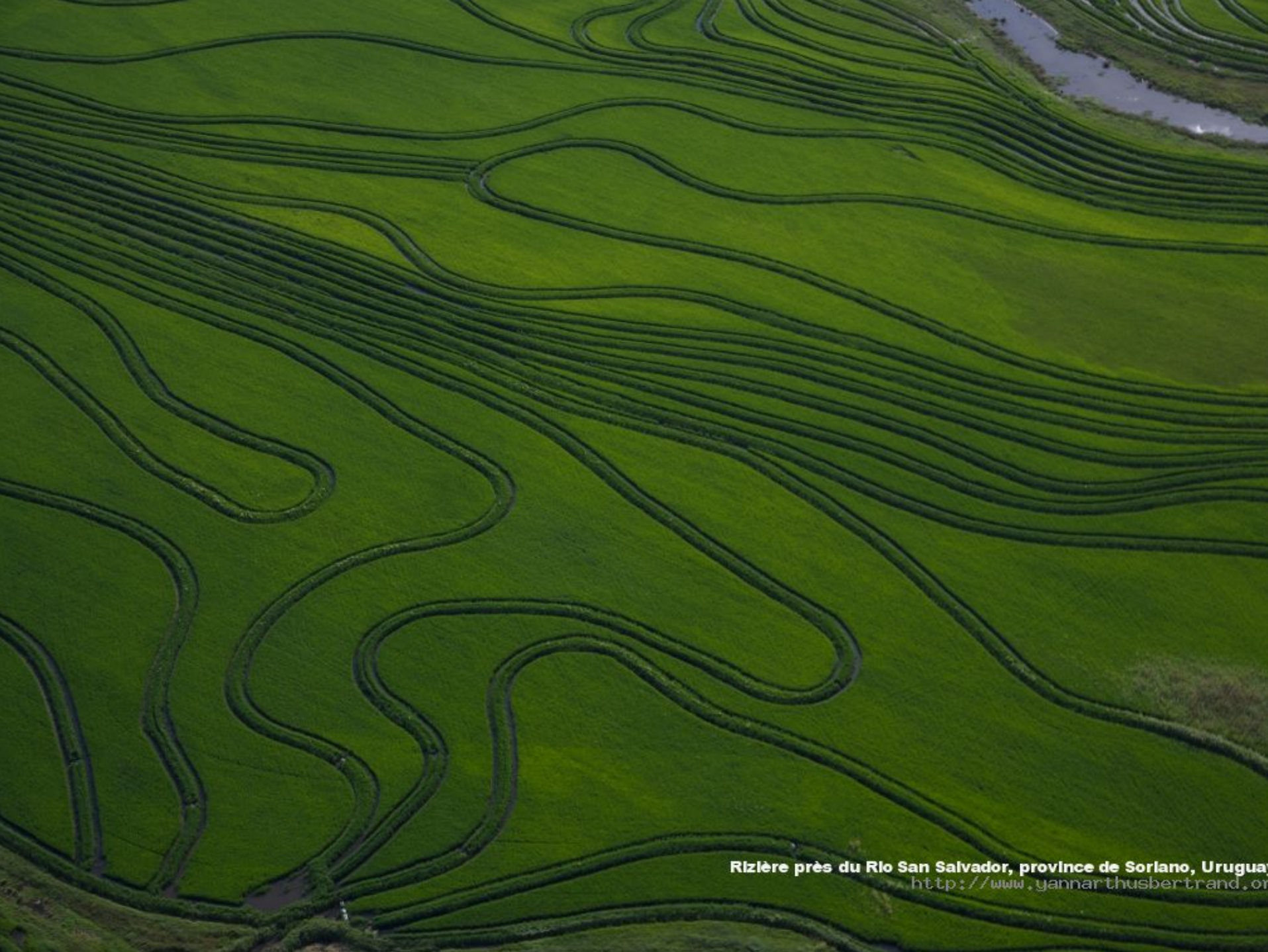
Rizière près du Río San Salvador, province de Soriano, Uruguay http://www.yannarthusbertrand.com