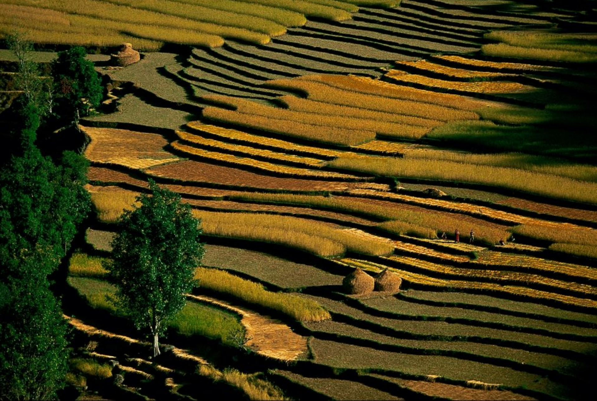
Rizières au sud de Pokhara, région du Pahar, Népal (N 27°49'-E 84°08'