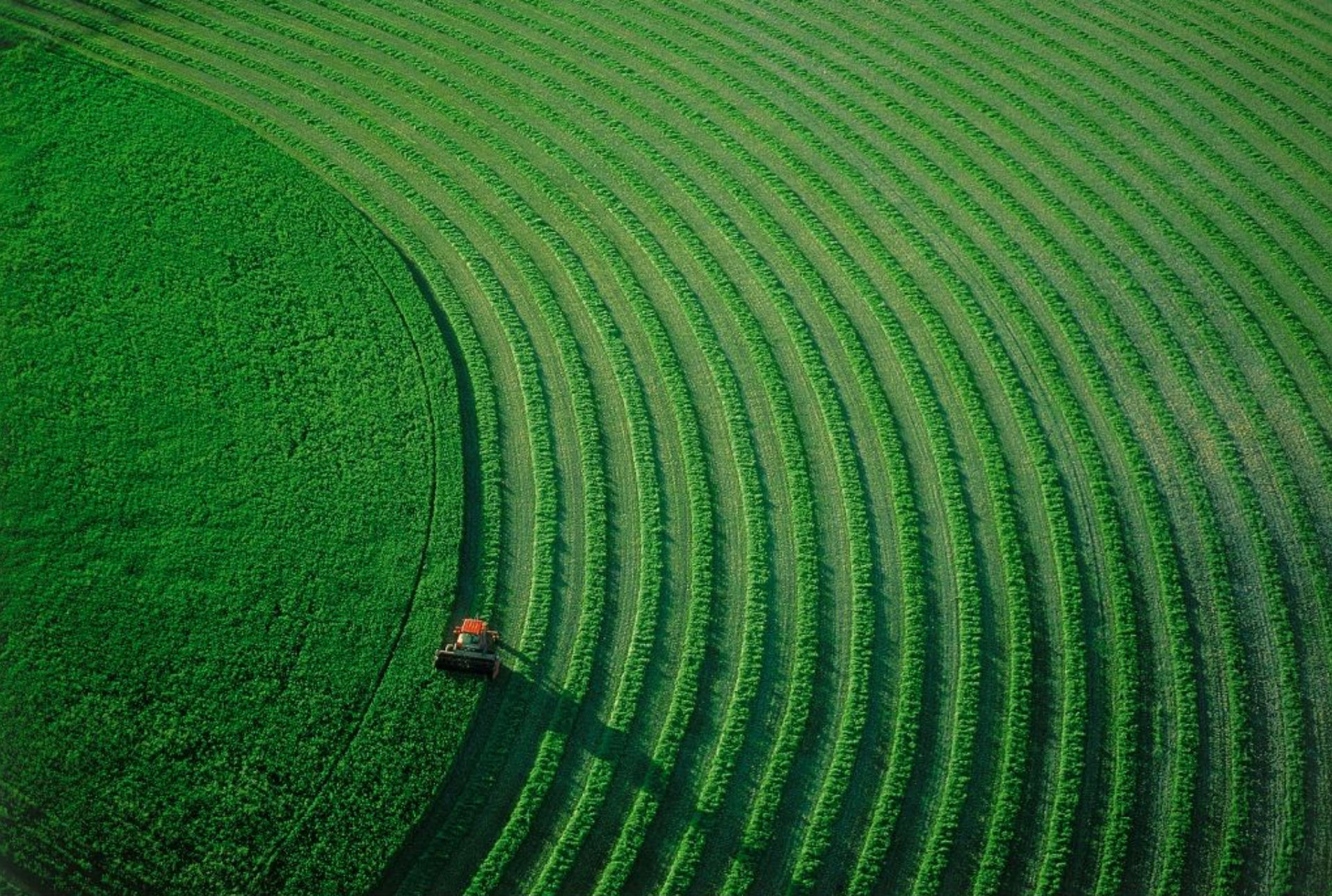
Tracteur dans un champ près de Bozeman, Montana, Etats-Unis (N 45°40'-O 111°02') http://www.yannarthusbertrand.org