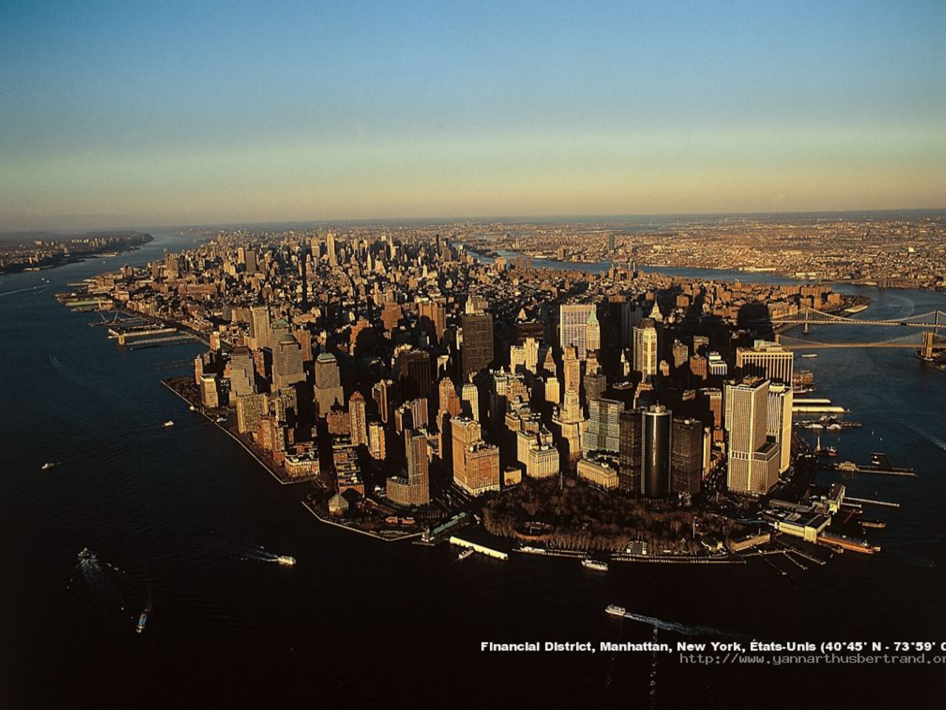
Financial District, Manhattan, New York, États-Unis (40°45' N - 73°59' O)