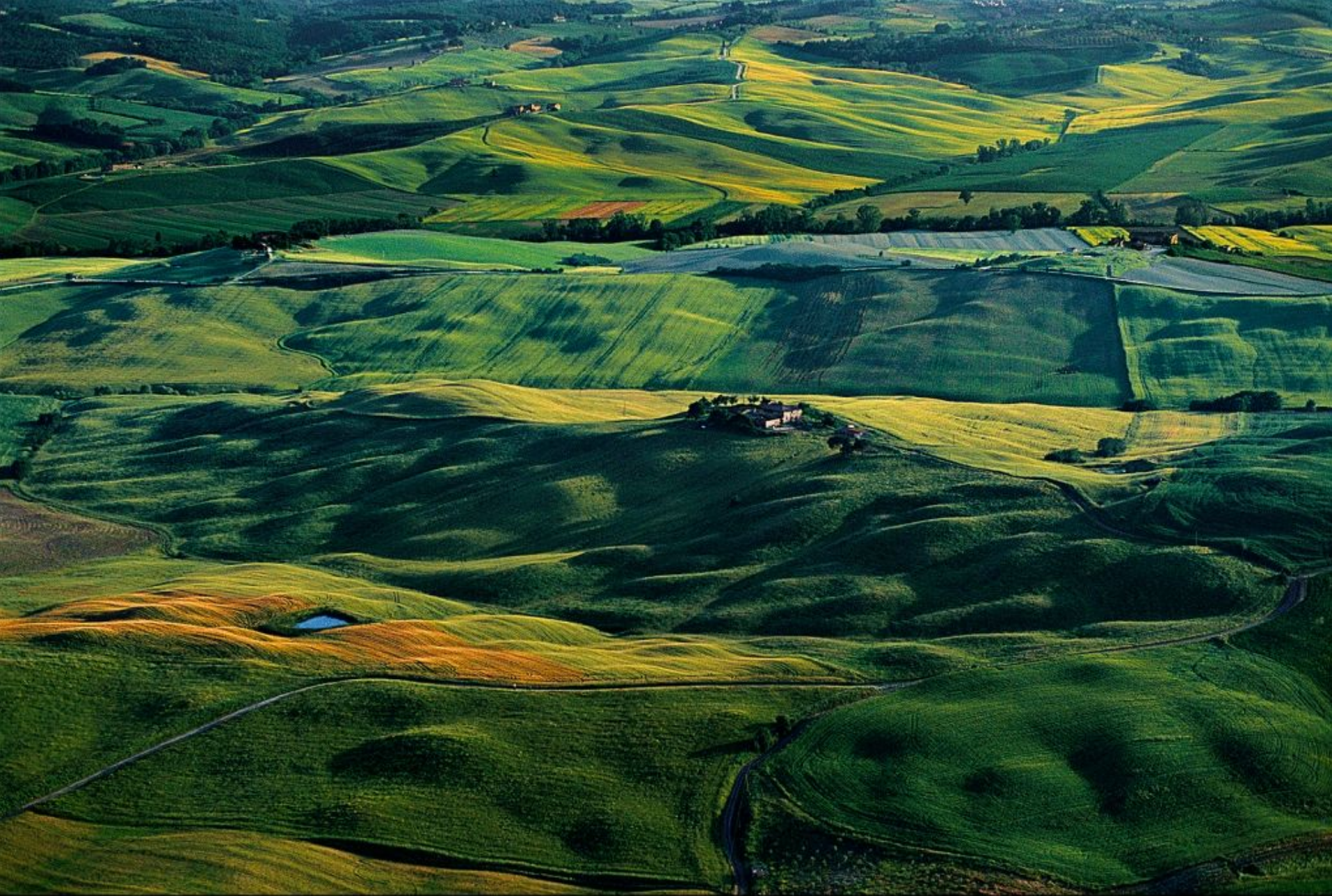
Campagne aux environs de Sienne, Toscane, Italie (43°19' N - 11°19' E). http://www.yannarthusbertrand.org