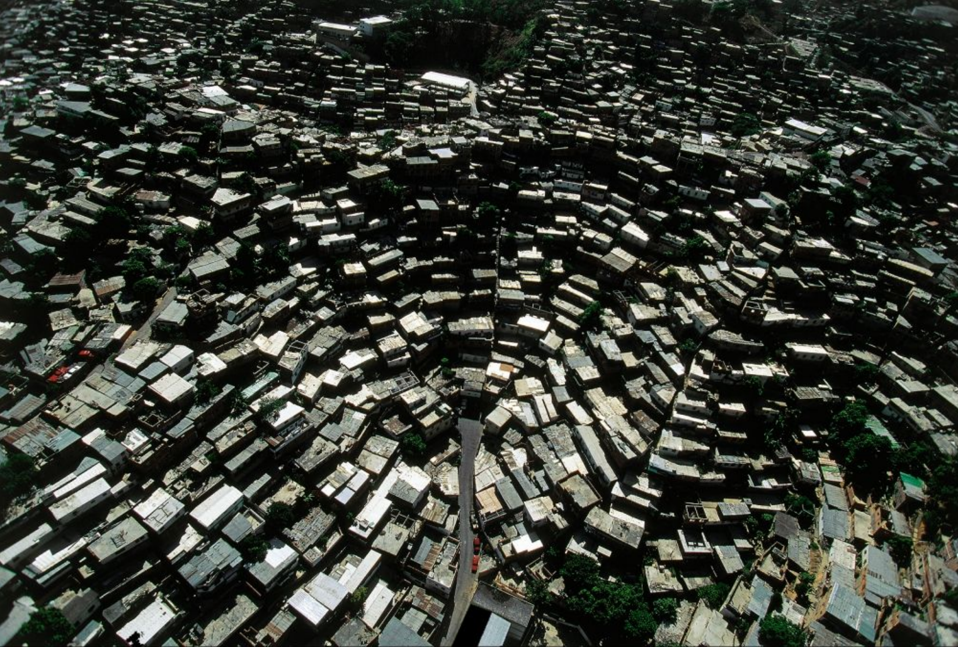
« Barrios » de Caracas, Venezuela (10°30' N - 66°56'