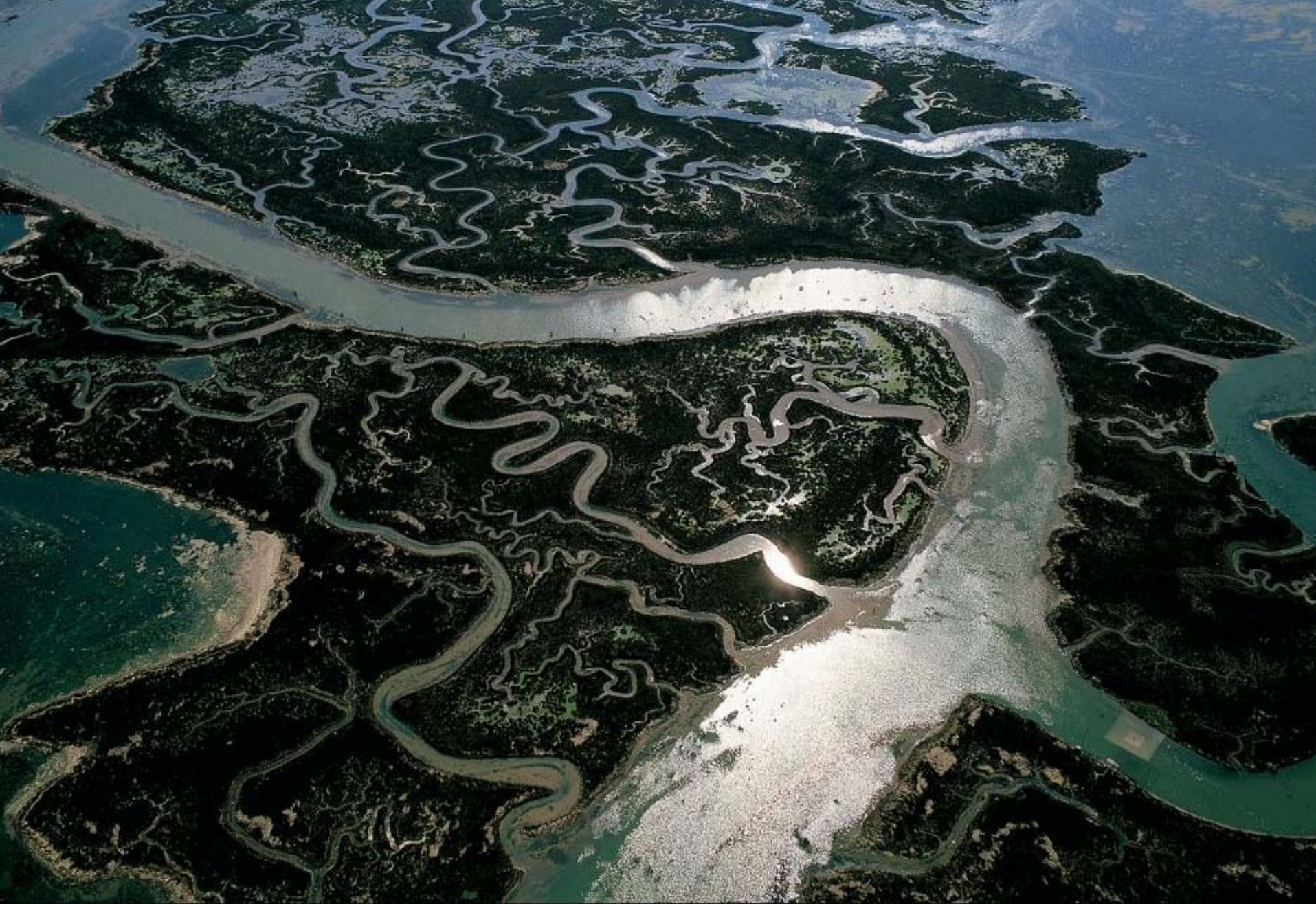
La lagune de Venise, Vénétie, Italie (45°25' N - 12°19' http://www.yannarthusbertrand.com