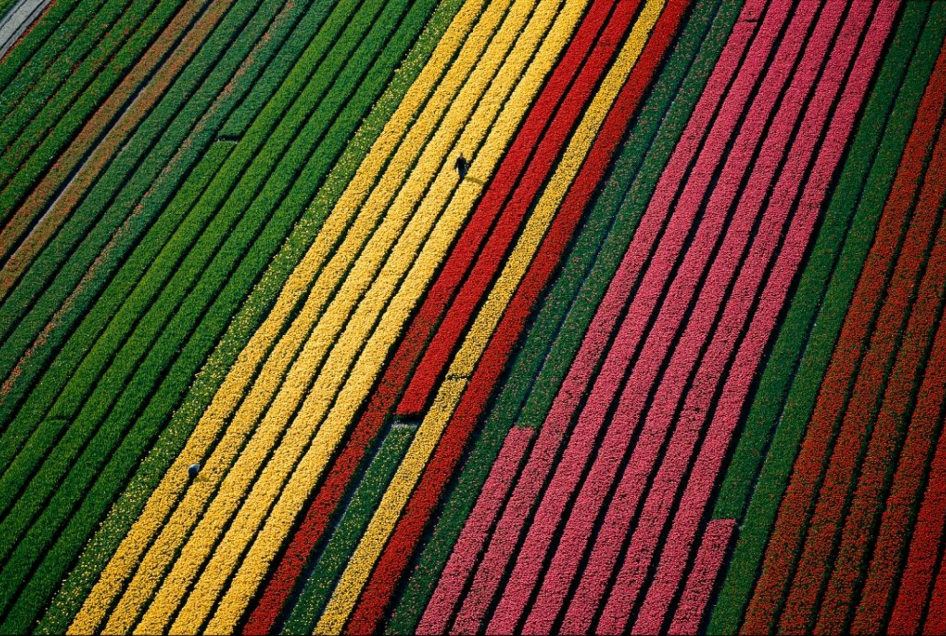
Champs de tulipes à proximité de Lisse, région d'Amsterdam, Pays-Bas (52°15' N - 4°37' E).