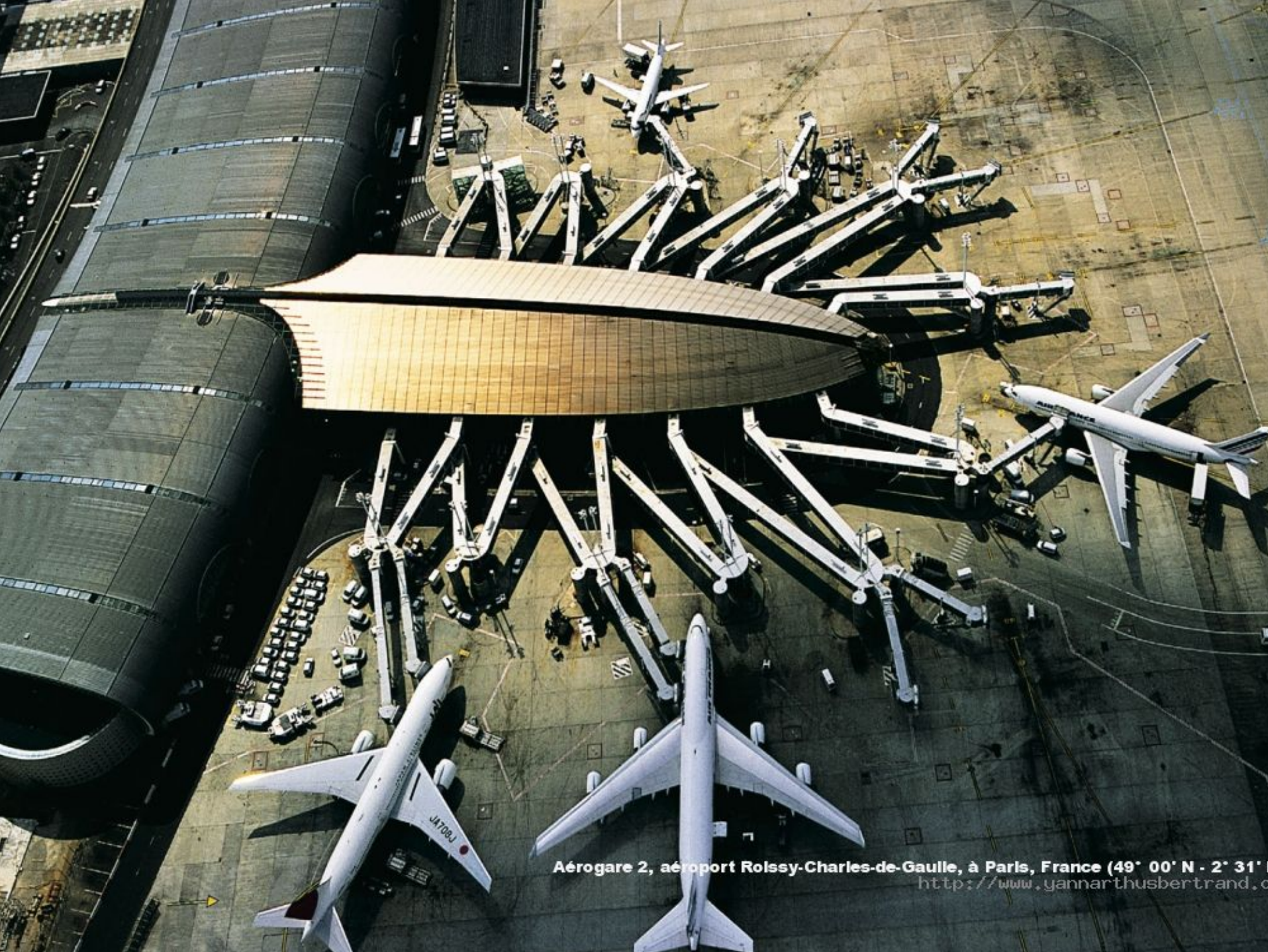
Aéroport 2, aéroport Roissy-Charles-de-Gaulle, à Paris, France (49° 00' N - 2° 31' E)