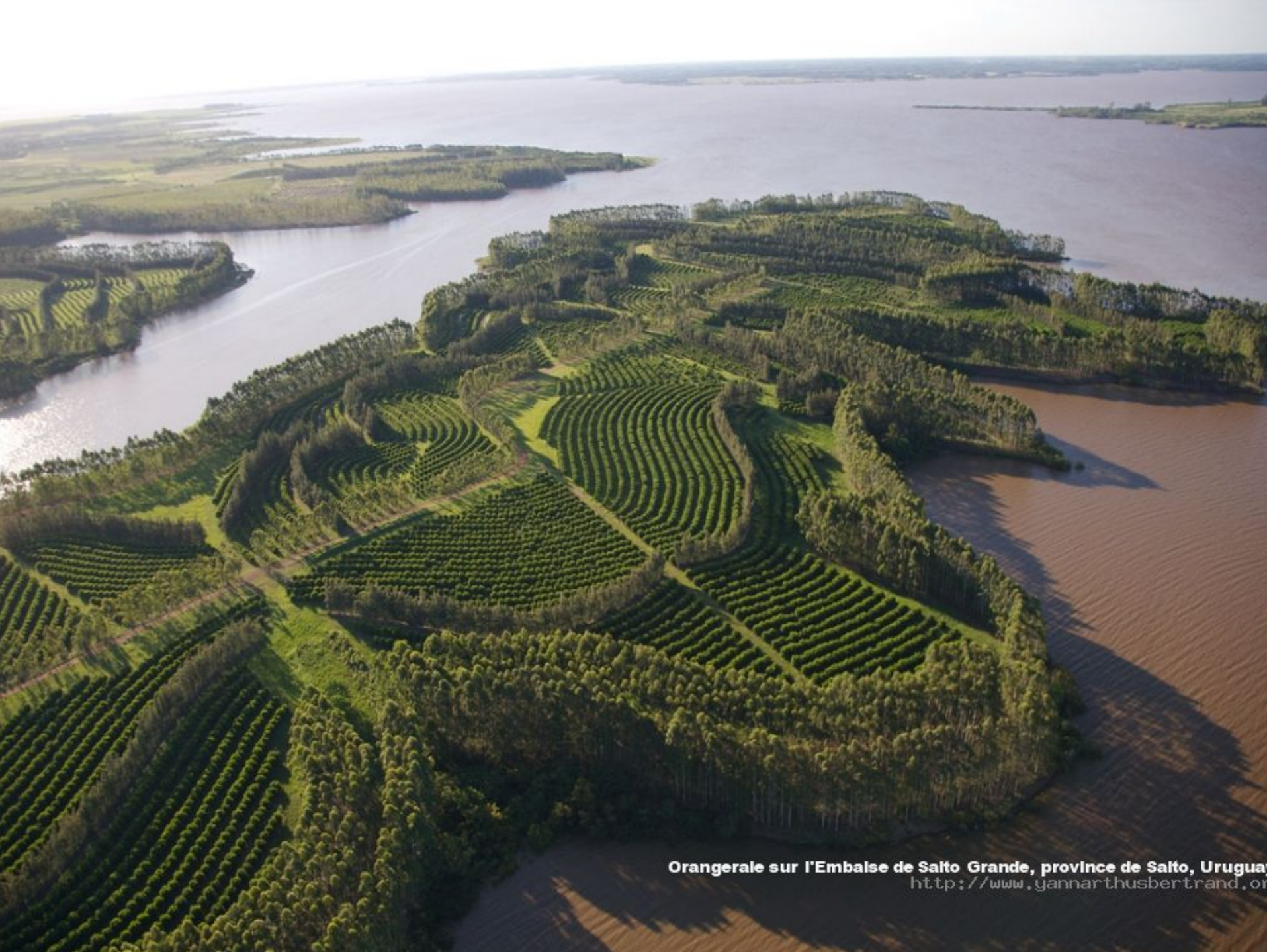
Orangerale sur l'Embalse de Salto Grande, province de Salto, Uruguay