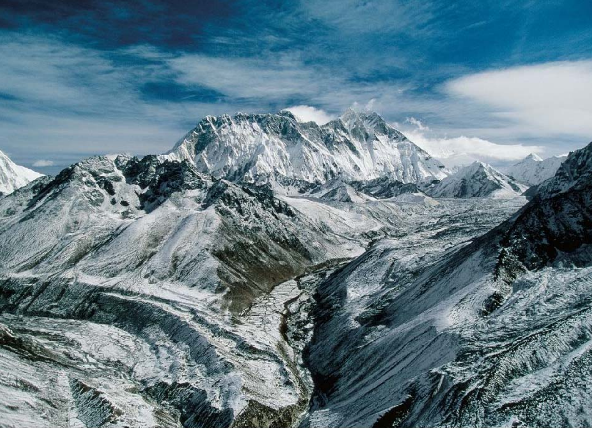
Mont Everest, Himalaya, Népal (27°59' N - 86°50' E) https://www.unep.org/fr/whats-new