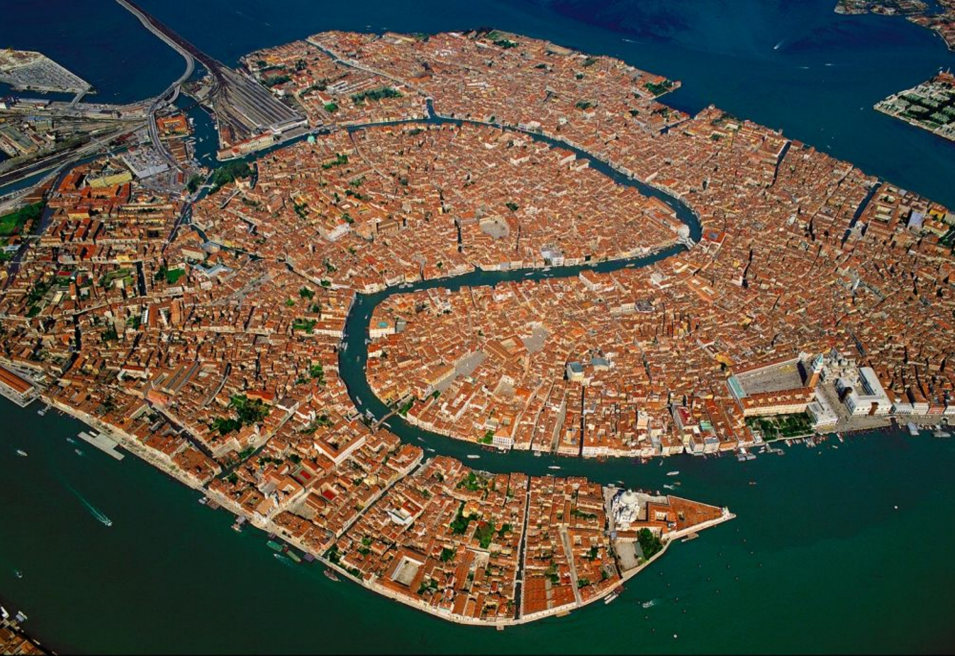
Vue générale de la ville de Venise, Vénétie, Italie (45°35' N - 12°34' E)