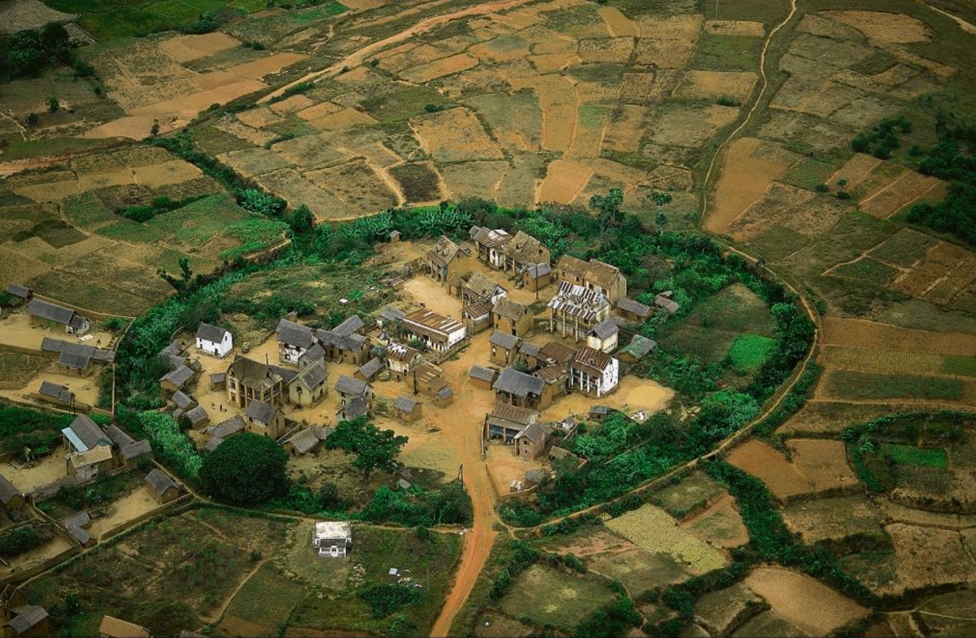
Village traditionnel au nord d'Antananarivo, Madagascar (18°49' S - 47°32' E) http://www.yannarthusbertrand.com