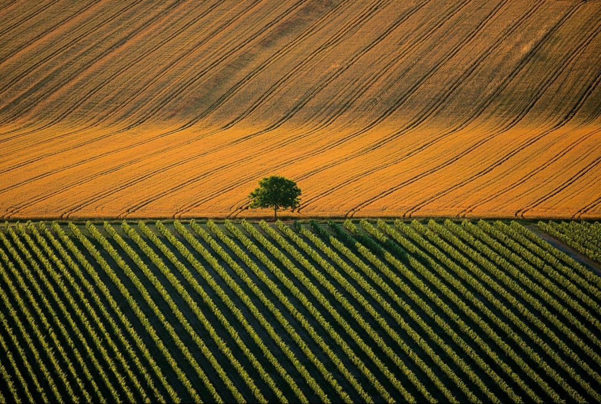
Paysage agricole près de Cognac, Charente, France (45°42' N - 0°17' O http://www.yannarthusbertrand.com