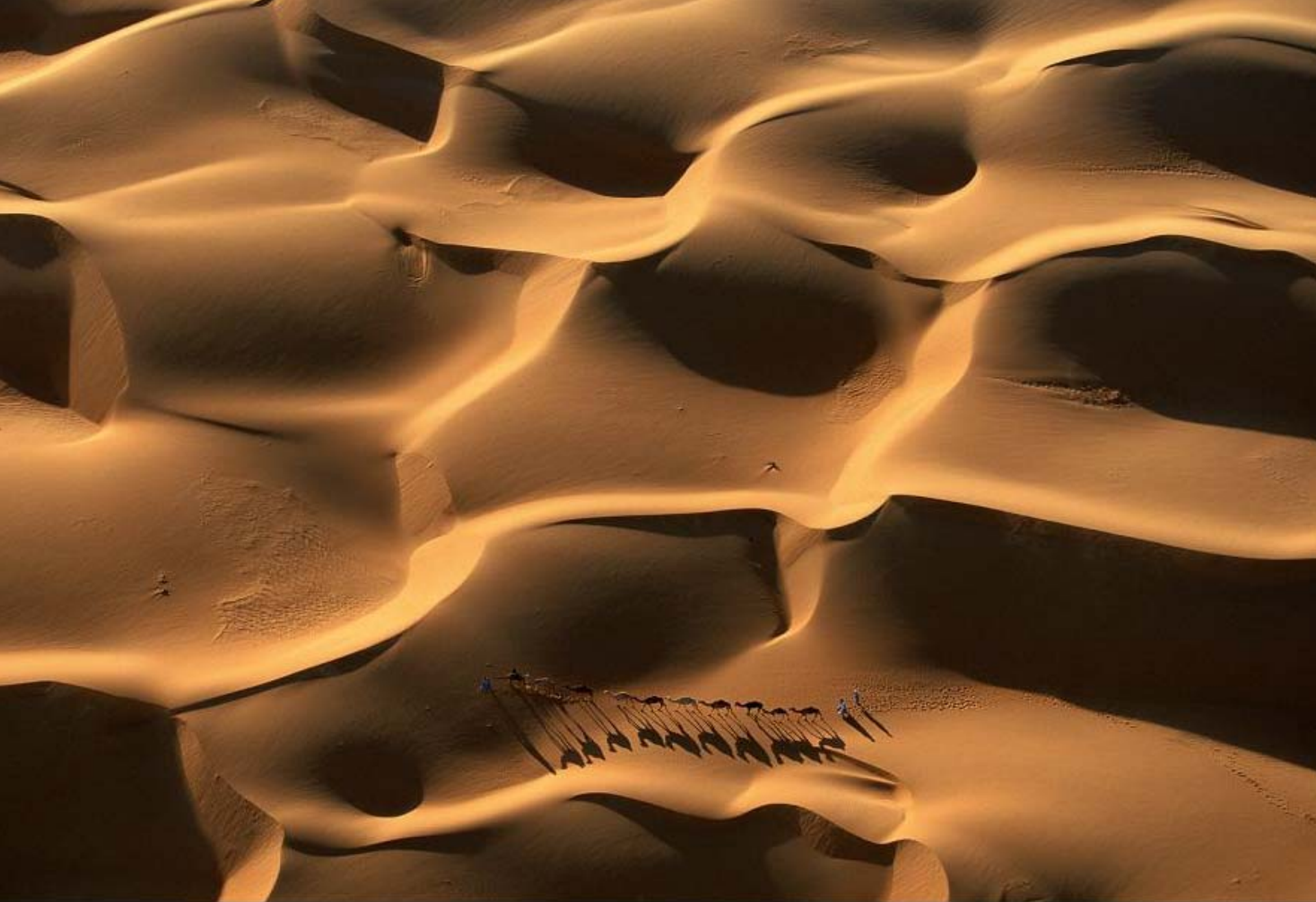
Caravane de dromadaires dans les dunes près de Nouakchott, Mauritanie (18°09' N - 15°29' O)