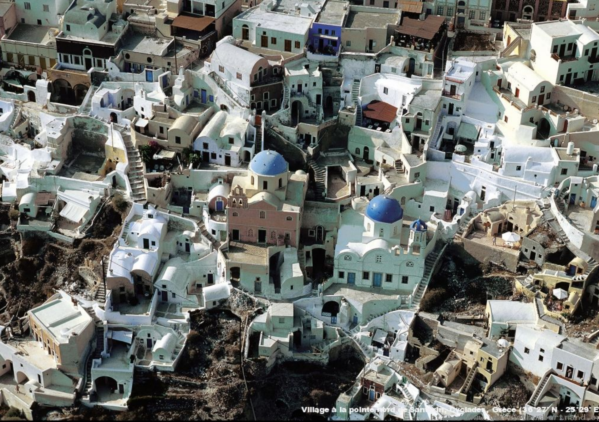
Village à la pointe nord de Santorini, Cyclades, Grèce (36°27' N - 25°29' E)