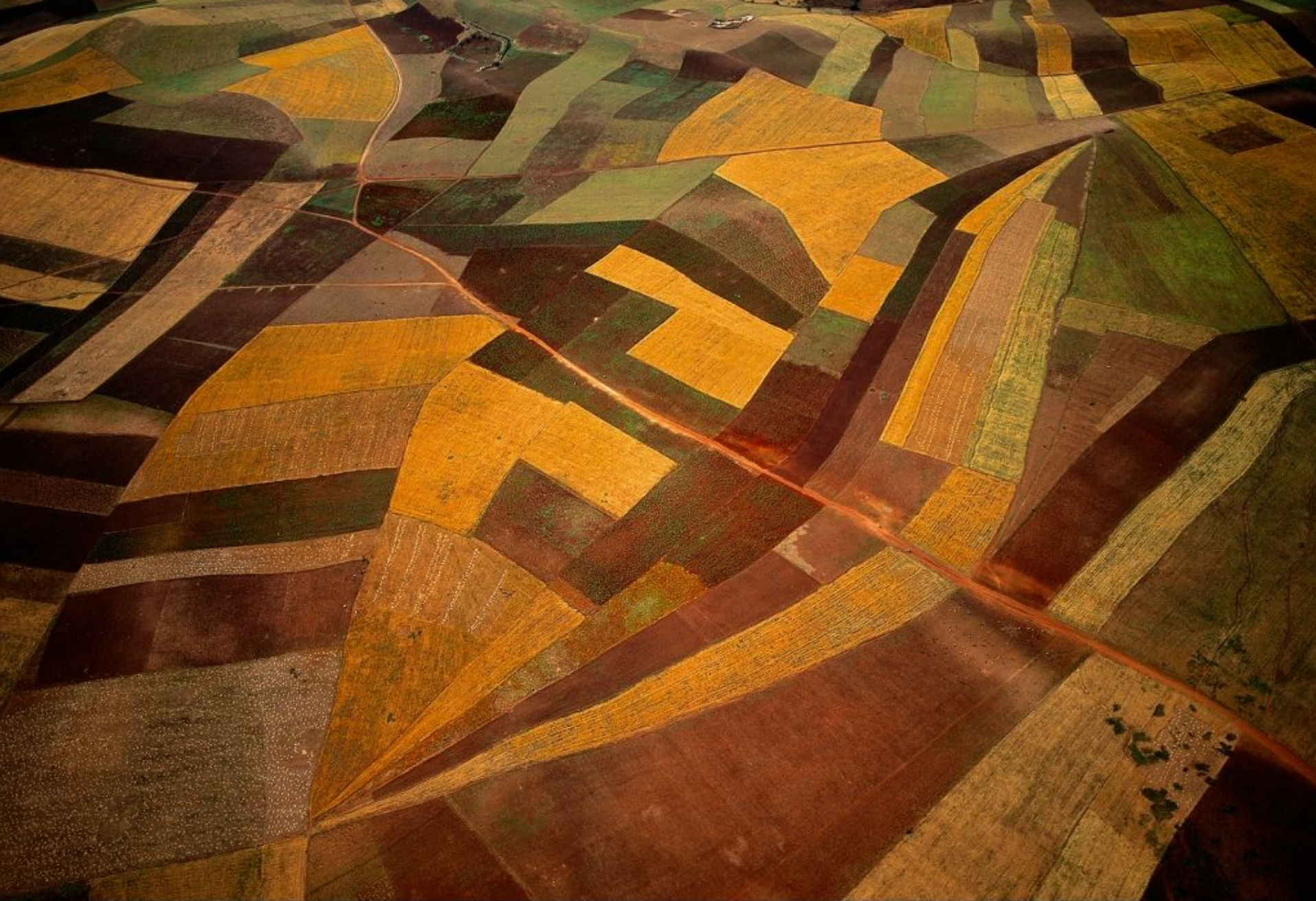
Paysage agricole entre le barrage Al Massira et Rabat, Maroc (32°33' N - 6°36' O ). http://www.yannarthusbertrand.org