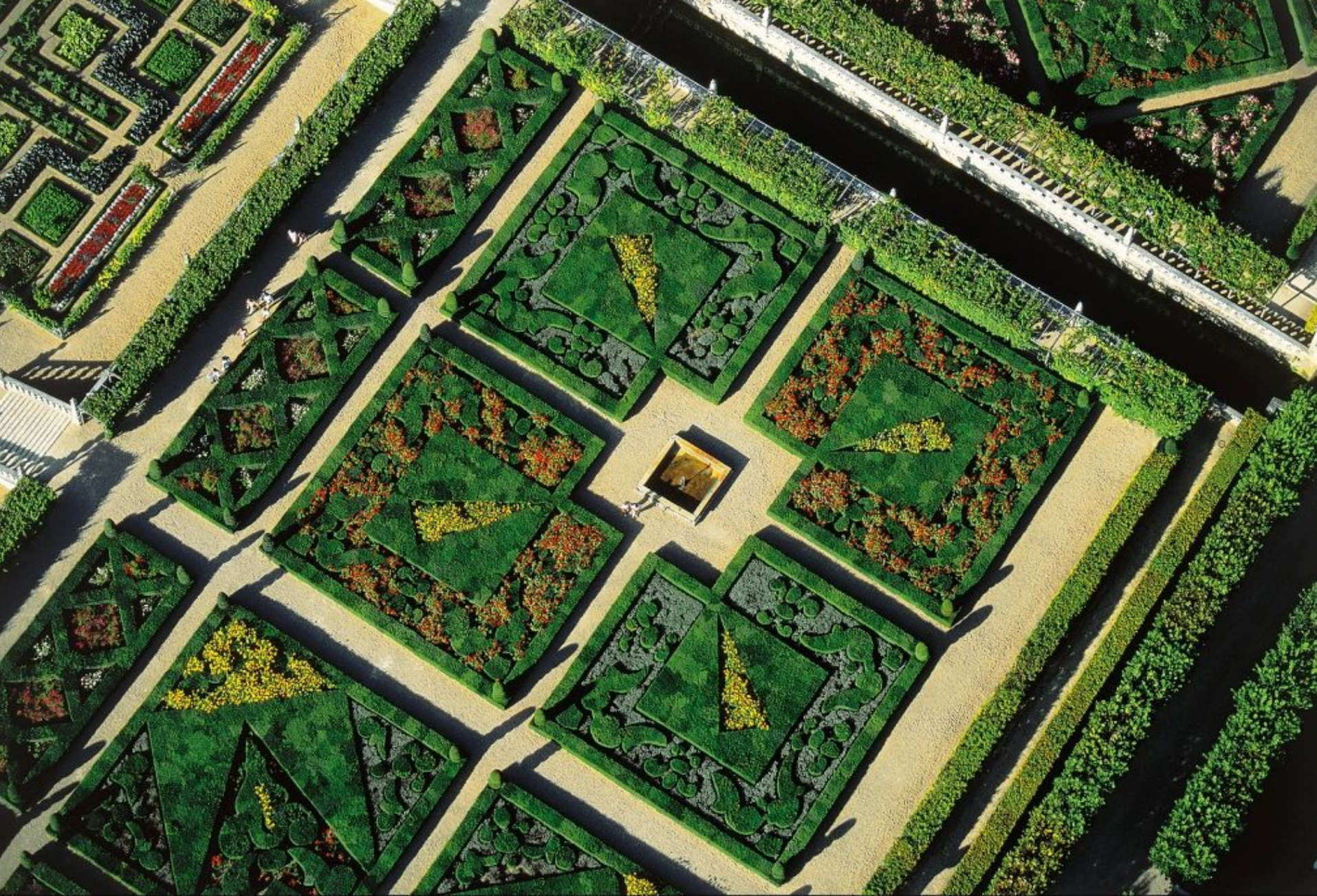
Les jardins du château de Villandry, Indre-et-Loire, France (N 47°20' E 0°30' http://www.yannarthusbertrand.org