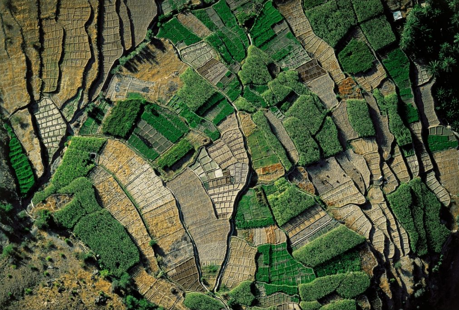
Cultures en terrasses dans le djebel Akhdar, Oman (23°30' N - 56°56' E)