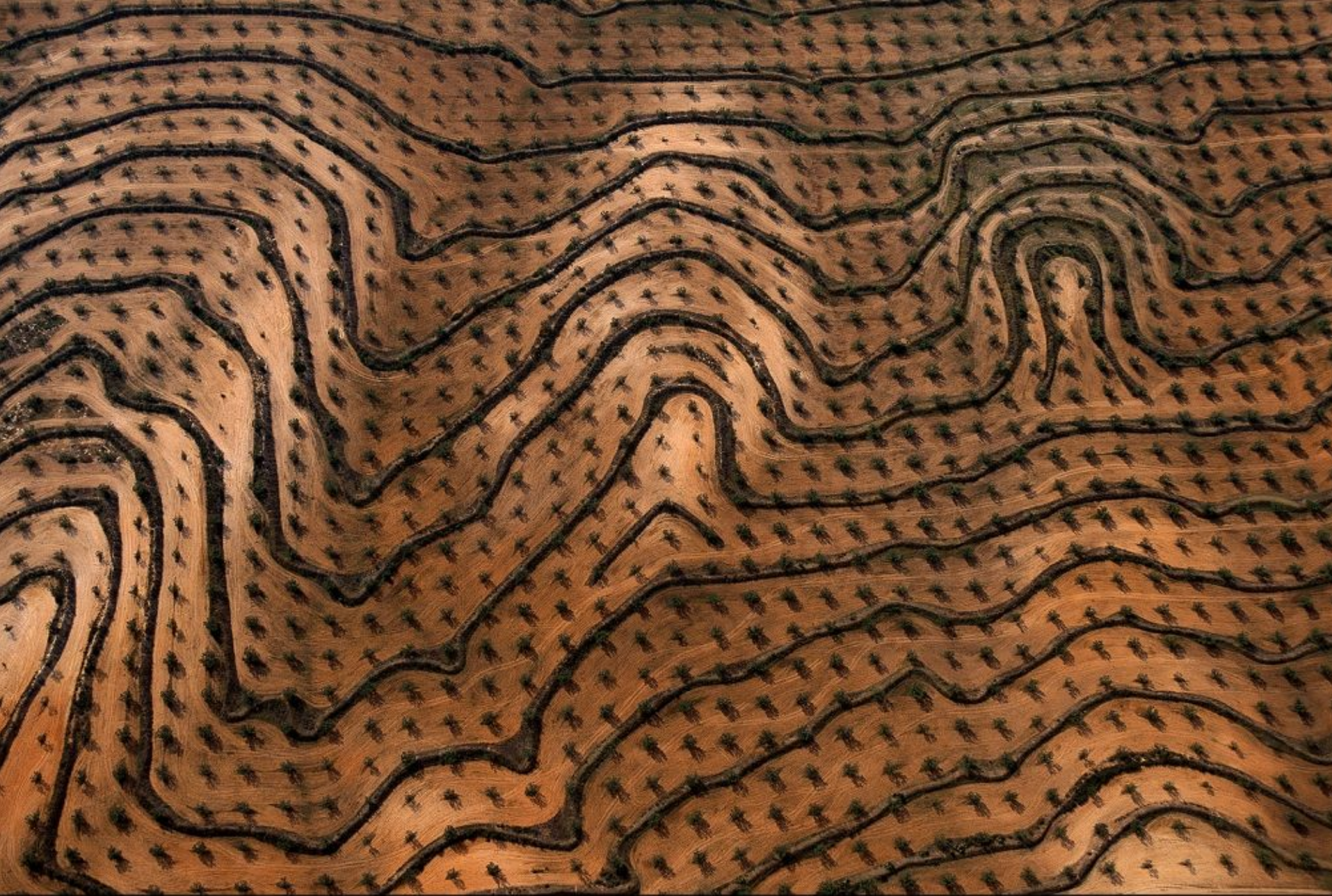
Nouvelles plantations d'oliviers, gouvernorat de Zaghouan, Tunisie (36°24' N - 10°23' E) http://www.yannarthusbertrand.com