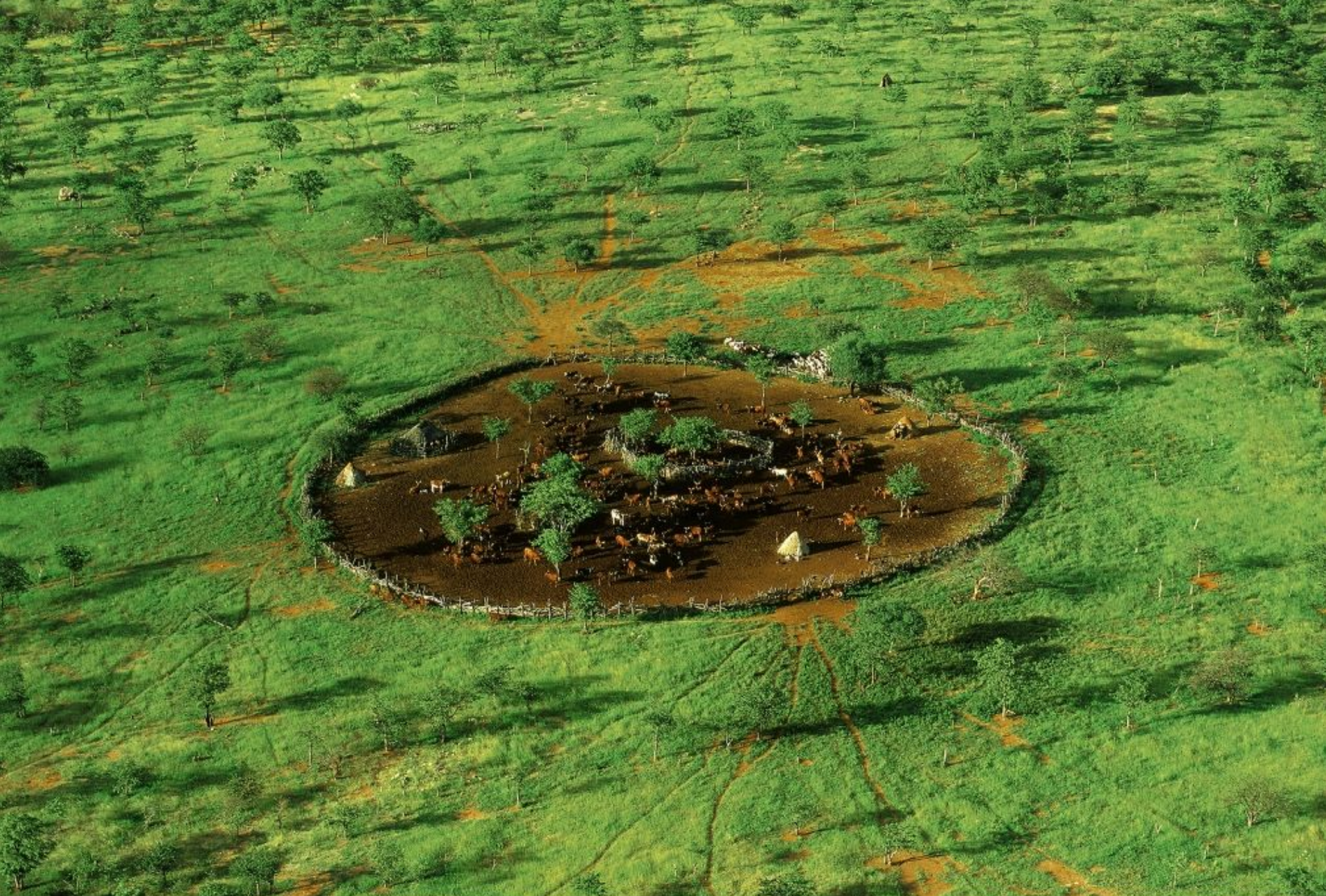
Vue générale sur un enclos de village Himbas, région du Kaokoland, Namibie (18°15' S - 13°00' E