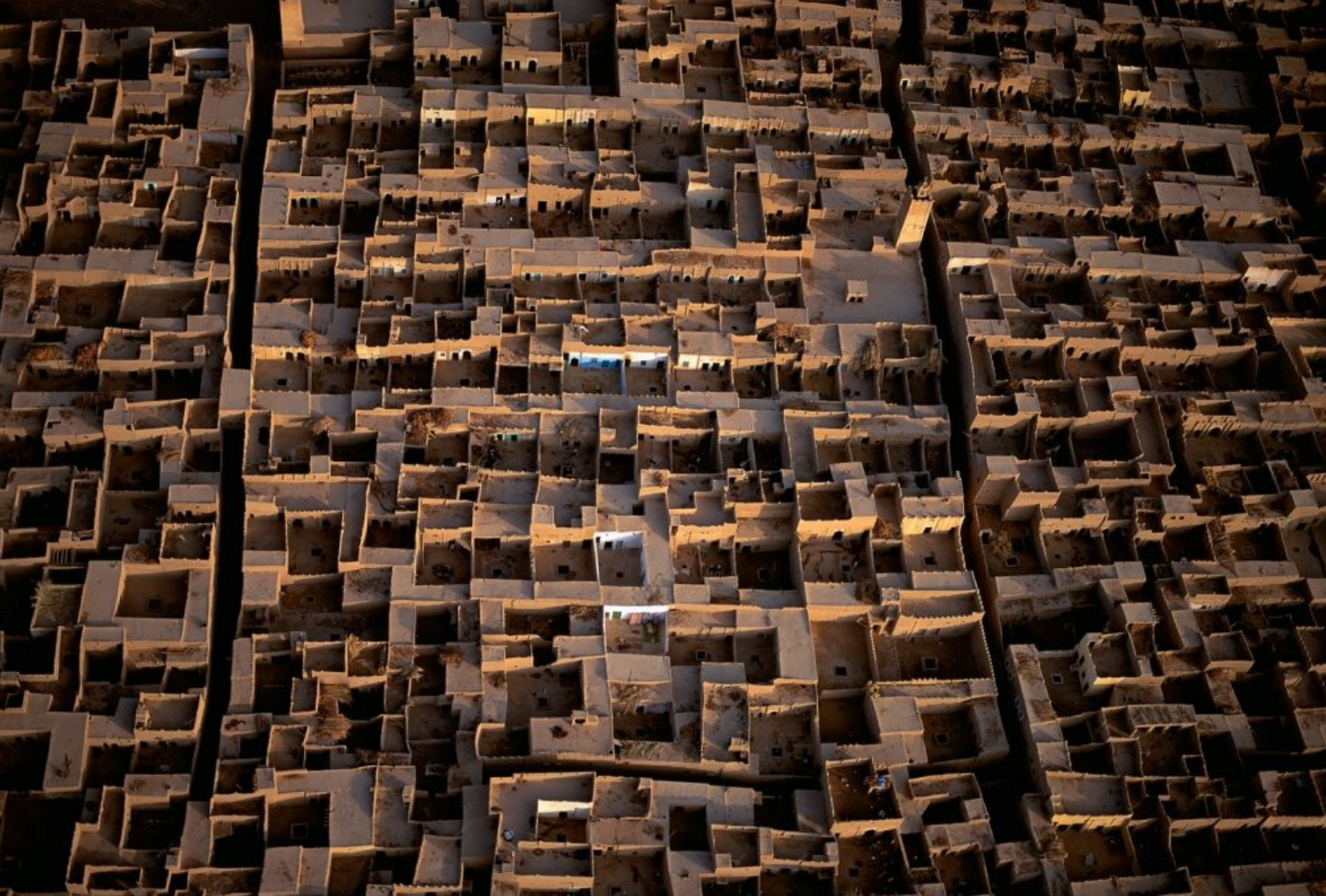
Village dans la vallée du Rhéris, région d'Ar-Rachida, Haut Atlas, Maroc (N 31°28' - O 4°10' http://www.yannarthusbertrand.com