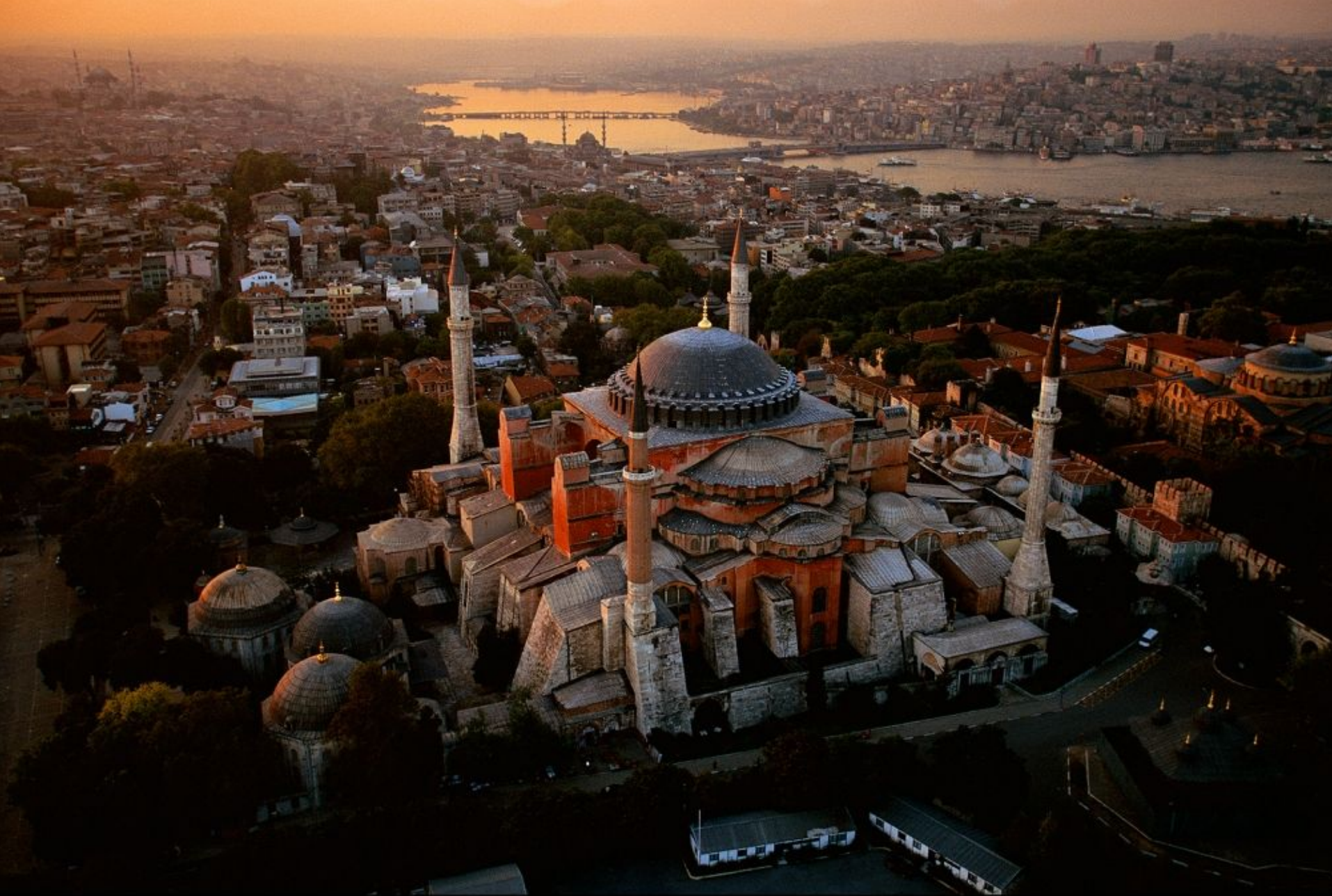
Basilique Sainte-Sophie à Istanbul, Turquie. (41°00' N- 28°59' E) http://www.yannarthusbertrand.com