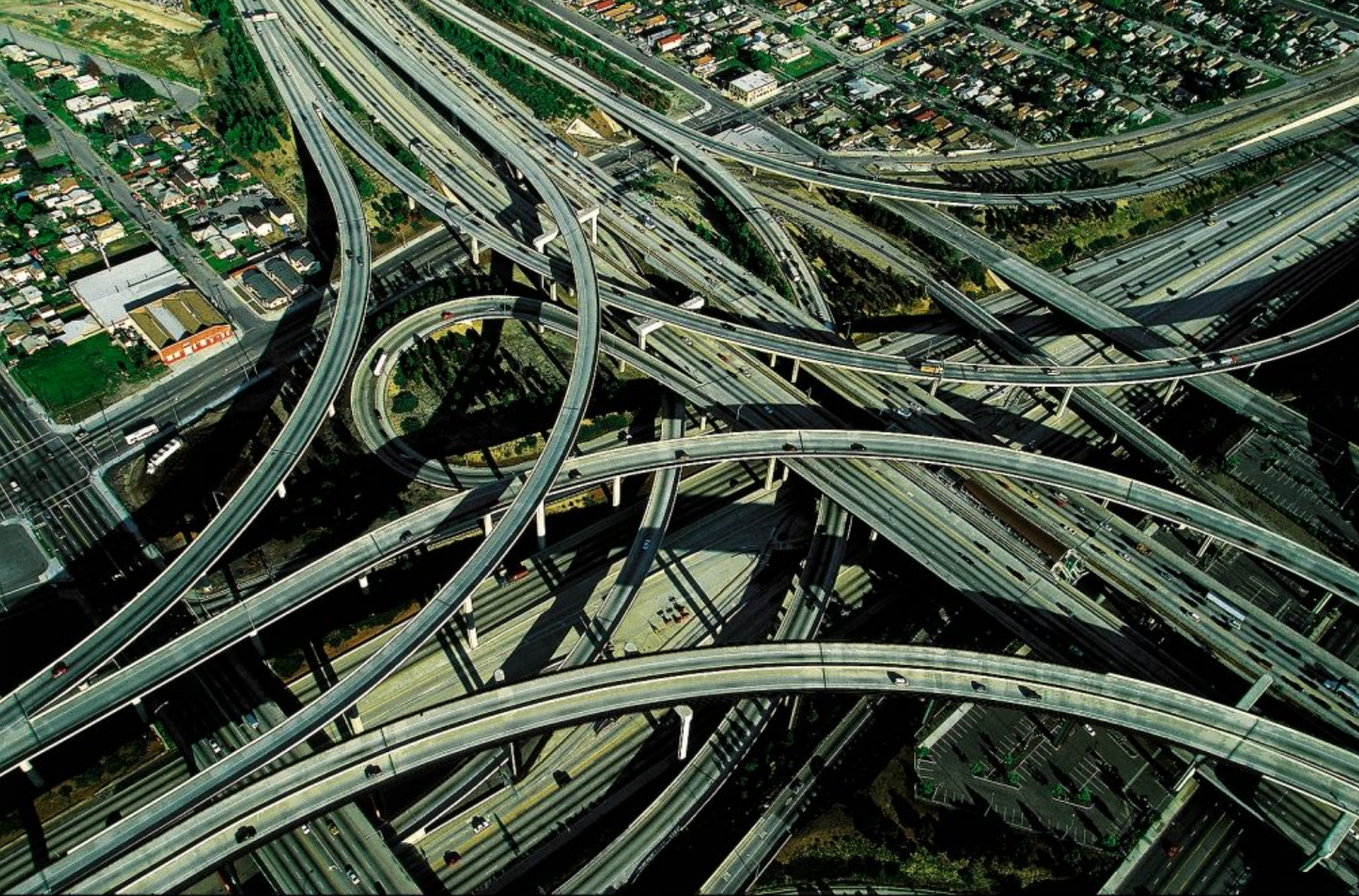
Échangeur entre les autoroutes 10 et 110, Los Angeles, Etats-Unis (N 34°02' - O 118°11') http://www.yannarthusbertrand.com