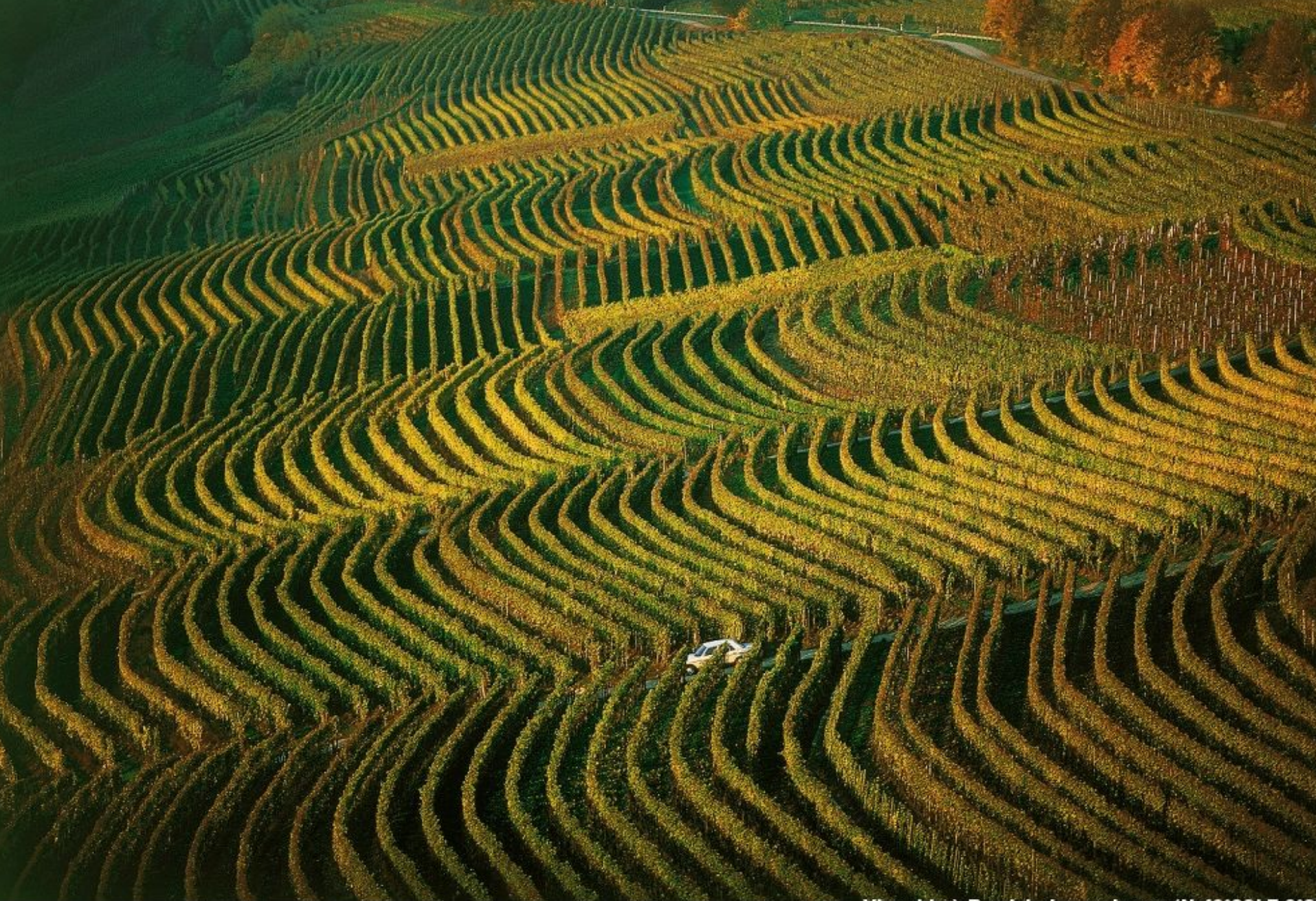
Vignoble à Remich, Luxembourg (N 49°33'E 6°2' http://www.yannarthusbertrand.com