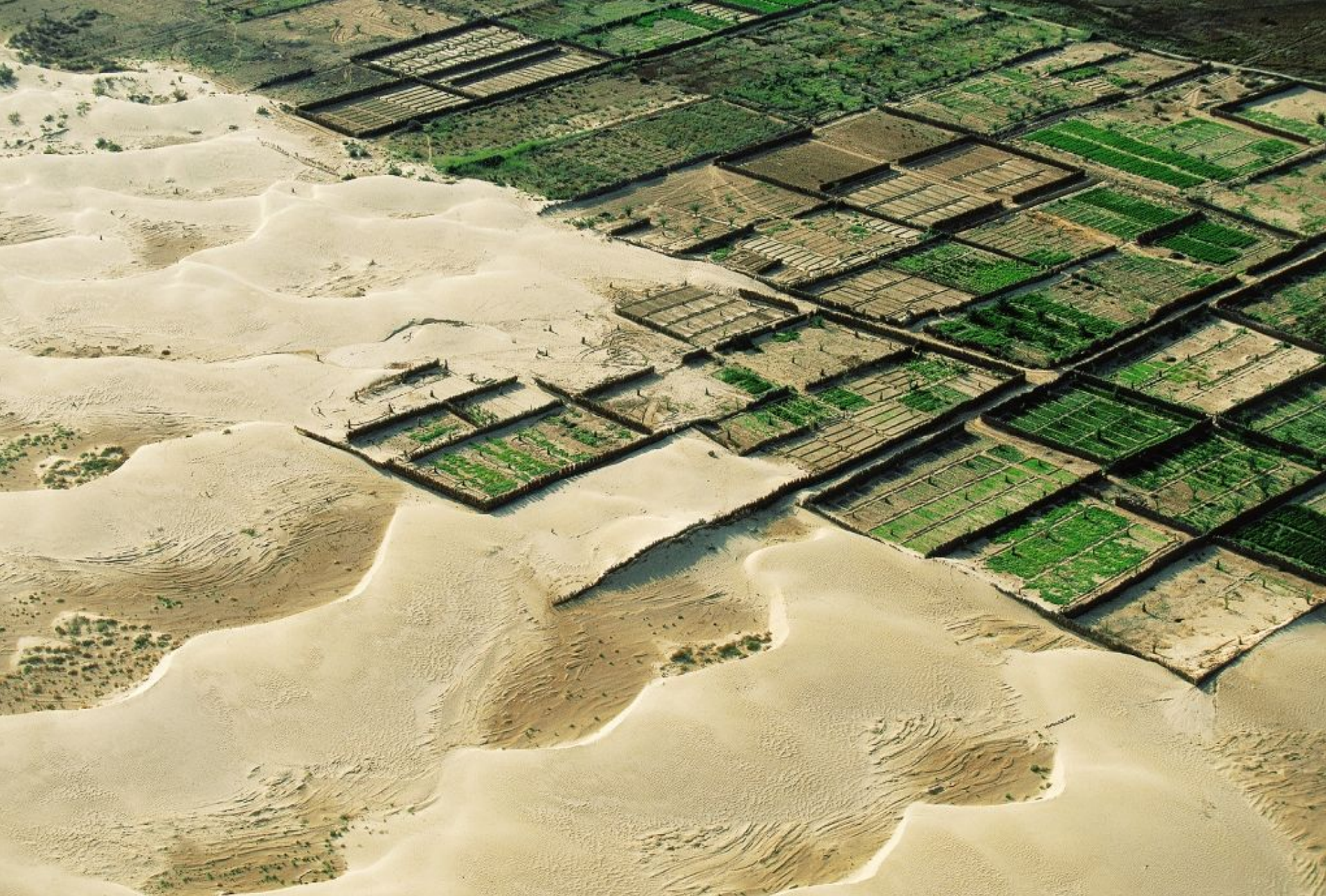
Oasis de Kebili, Nefzaoua, Tunisie (33°42' N - 8°58' E). http://www.yannarthusbertrand.org