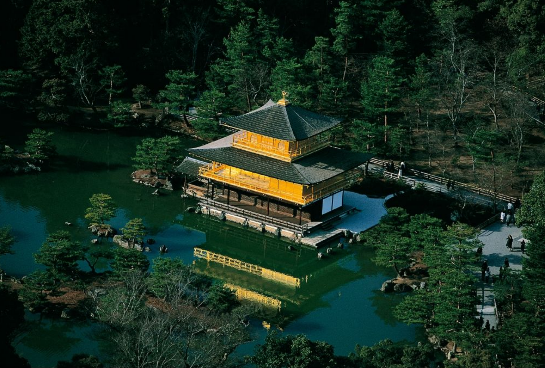
Pavillon d'or à Kyoto, Japon (35°00' N - 135°45' E).