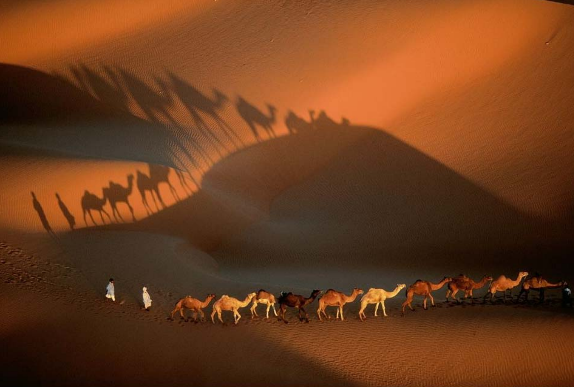
Caravane de dromadaïres aux environs de Nouakchott, Mauritanie (18°09' N - 15°2' http://www.gannarthusbertran